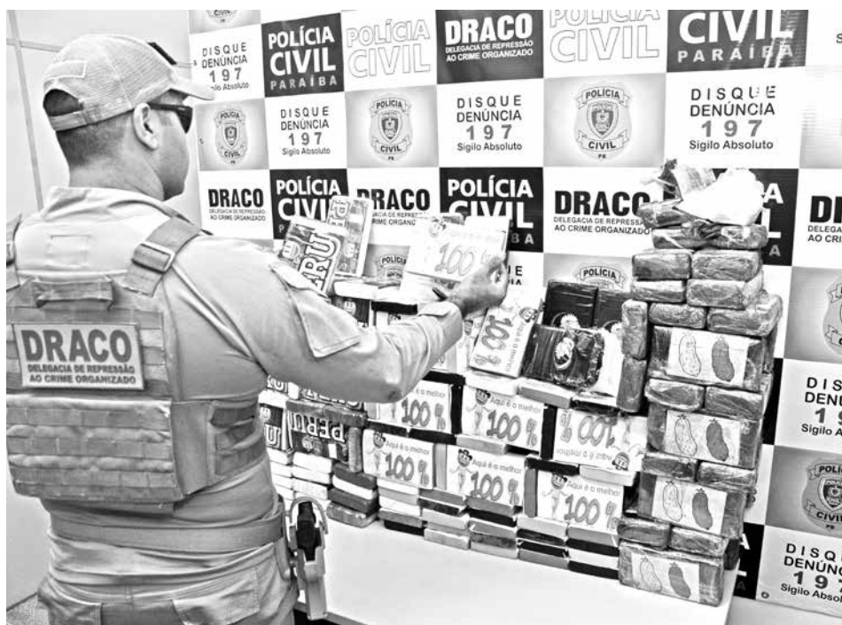
Cocaína estava em embalagens onde estava escrito: "Aqui é o melhor, 100%"

"Aqui é o melhor, 100%". Essa foi a maior apreensão de cocaína já realizada pela Draco. Os dois presos são da Bahia e Pernambuco, e um deles já tinha passagem pela polícia por porte ilegal de drogas. Eles deverão passar por audiência de custódia hoje.