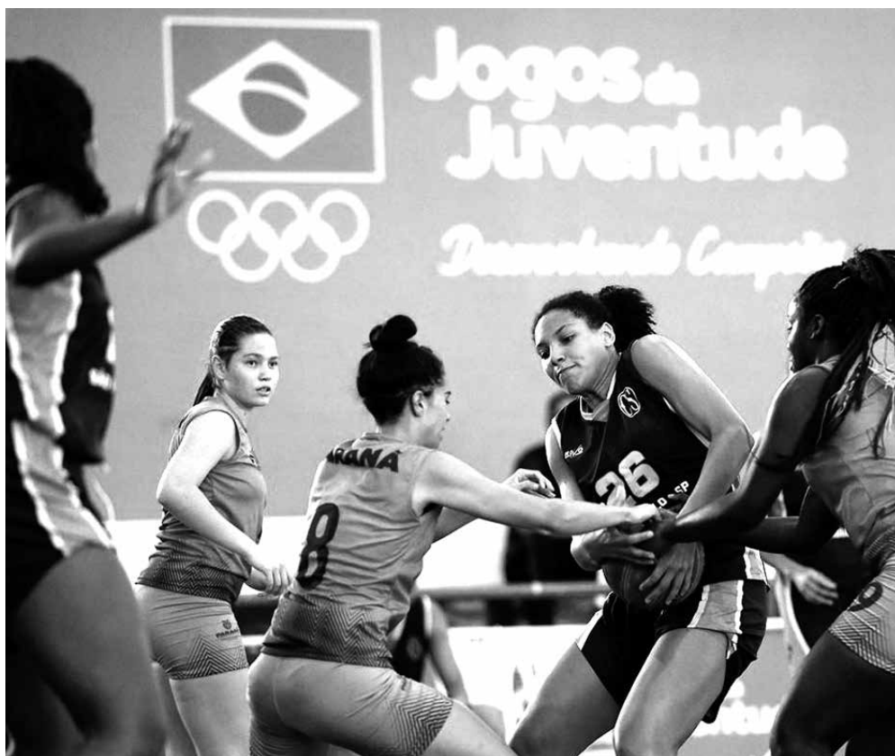
Os Jogos da Juventude vão acontecer de 1 a 16 de setembro no interior paulista

Não eram apenas sete racistas, era um estádio inteiro gritando, vibrando e urrando após a injustificável expulsão do brasileiro. Se o país não enfrenta o racismo com seriedade, é preciso que o esporte o faça, e o âmbito esportivo, ainda que incipiente para garantir o respeito, é ideal para sufocar a prática e reprimir aqueles que se julgam superiores pela cor da pele. A perda de pontos para o time que tem racistas em sua torcida é o mínimo a ser aplicado, e já se mostrou prática eficaz para contornar outras questões em campo. No papel, a Fifa diz que já recomenda. Falta pôr em prática.