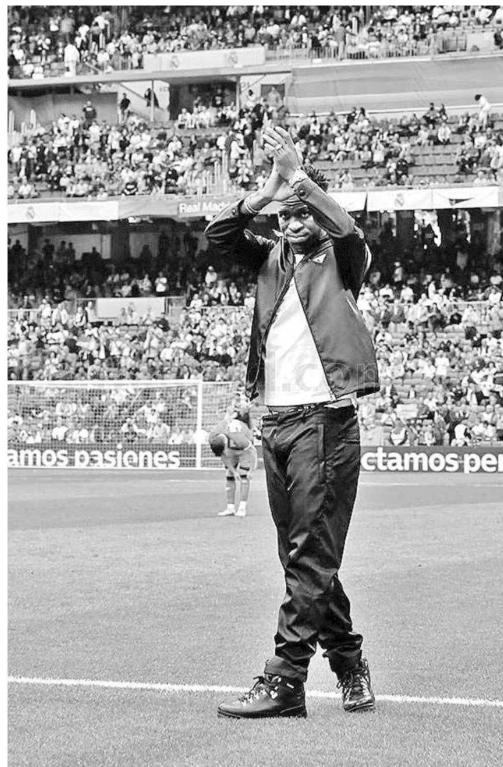
Vini Júnior agradece as homenagens de torcedores e jogadores

4 de junho Data da última participação do Real Madrid no Campeonato Espanhol