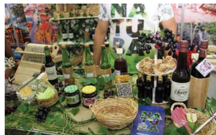
Produtor de uva, Natuba expõe uvas e geleias cultivadas na região