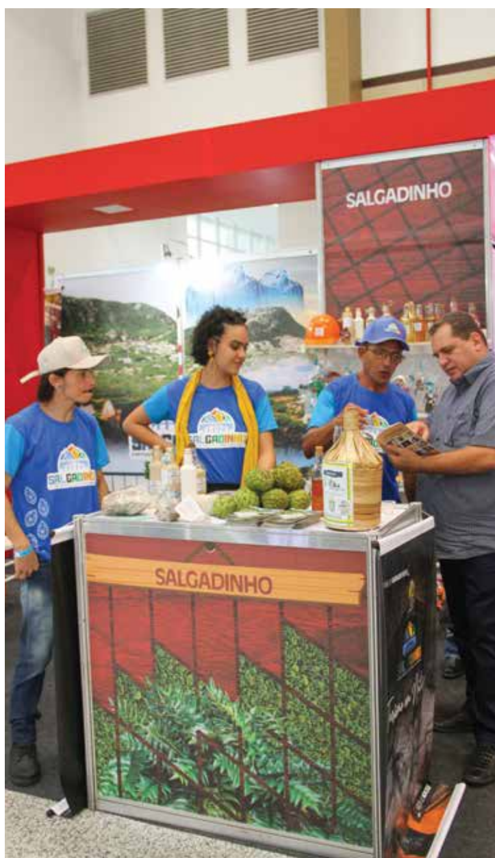
Estande da cidade de Salgadinho, conhecida como “Oásis do Sertão”

A Expo Turismo reúne produtos, rotas e roteiros turísticos e produção associada ao turismo, das 12 regiões turísticas da Paraíba em uma área total de 20 mil metros quadrados. A feira tem como objetivo promover e fortalecer os negócios do setor turístico no estado, gerando empregos, renda e movimentando a economia local. A expectativa é de que 18 mil pessoas passem pelo Centro de Convenções durante os três dias da feira.