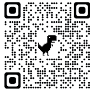
Através do QR Code acima, acesse o canal da Rádio Tabajara

Após as duas noites de eliminatórias, a organização vai disponibilizar o link no site da Rádio Tabajara para escolha da Melhor Canção. Lá, estarão disponíveis as 14 canções finalistas para ouvir e votar. O Festival de Música da Paraíba é uma realização do Governo do Estado, por meio da EPC, Secretaria Institucional de Comunicação (Secom) e Fundação Espaço Cultural (Funesc).