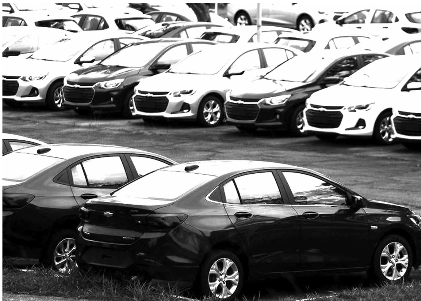
A produção de veículos aumentou 8% no primeiro trimestre do ano em comparação com o mesmo período de 2022

E, por fim, o critério da densidade industrial. “O mundo inteiro, hoje, procura