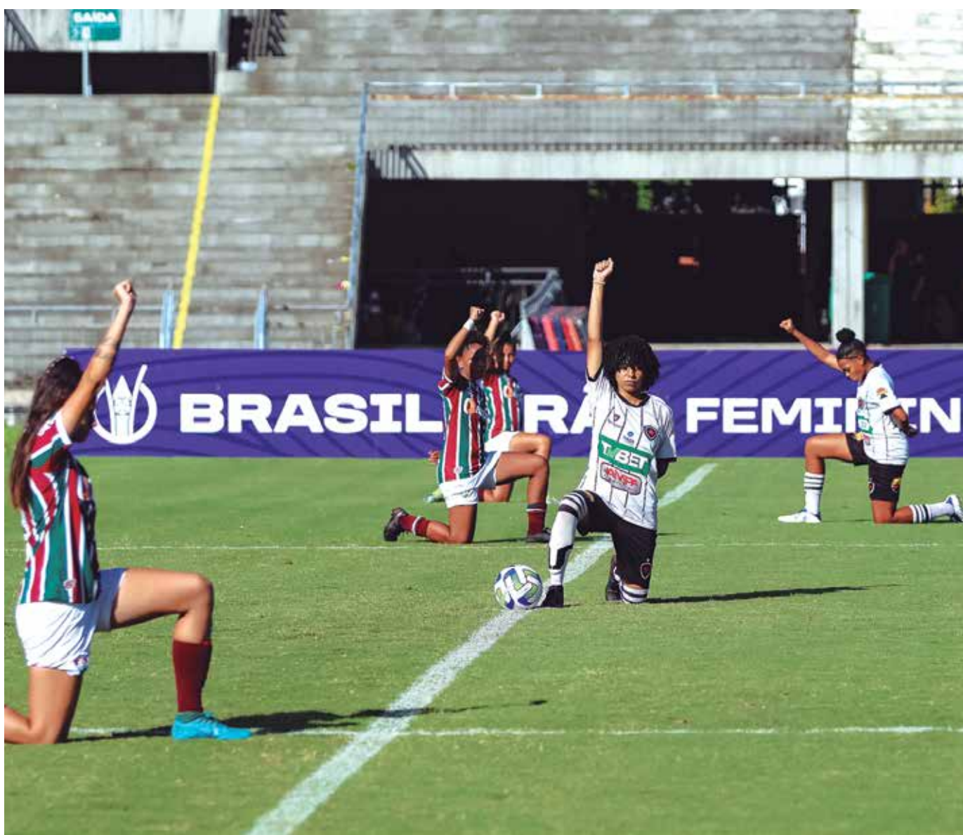
Antes do jogo da última quarta-feira, na derrota para o Flu-RJ, as atletas realizaram um protesto contra o racismo