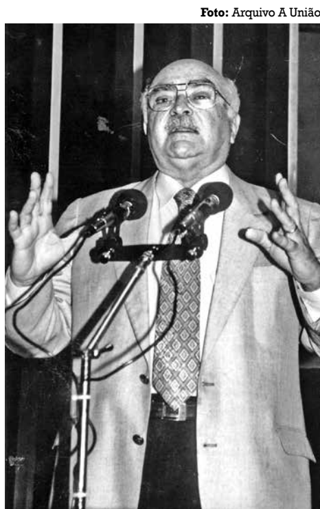
Político Wilson Leite Braga (1931-2020)

Sua primeira aparição na imprensa estadual foi no extinto Jornal O Norte , em 1952, na edição de 13 de janeiro, que destacava o seu entendimento com o governador José Américo de Almeida para construção da casa de apoio ao estudante, aparelho responsável por acolher estudantes que chegavam das mais diversas regiões do estado, em busca do tão sonhado diploma de curso superior, um privilégio para poucos, naquela época. Surge,