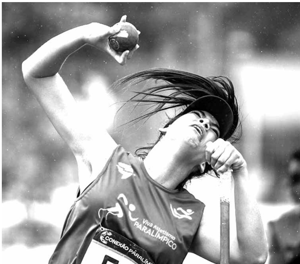
A primeira disputa da Conexão Paralímpica aconteceu em 2022, em João Pessoa

tercentros (competição entre alunos dos Centros de Referência do CPB) e as Paralimpíadas Militares (que têm o objetivo de estimular a prática esportiva entre militares e agentes de segurança com deficiência), terá fases regionais. Em João Pessoa o evento acontece em julho. A capital paulista e a cidade de Goiânia (GO) também funcionarão como sede. Em outubro, a temporada será encerrada com uma fase nacional, novamente em São Paulo. No ano passado, o Conexão Paralímpica aconteceu em João Pessoa, no ginásio da Fundação Centro Integrado de Apoio à Pessoa com Deficiência (Funad) e reuniu 510 paratletas nos três dias de competições.