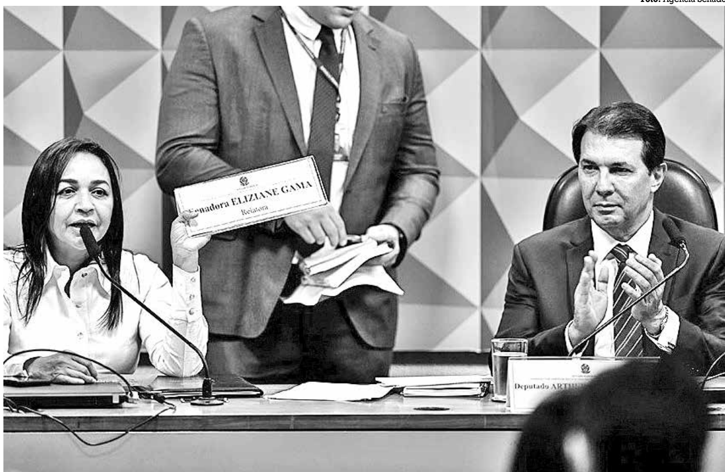
A senadora Eliziane Gama e o deputado Arthur Lira agora vão definir o cronograma de trabalho da CPMI dos Atos Golpistas

O advogado Floriano de Azevedo Marques também foi nomeado no DOU ontem como ministro substituto do TSE, embora ele não tenha participado da sessão plenária.