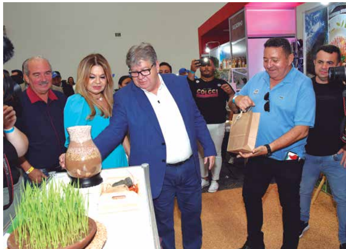
Governador diz que o evento promove não só a divulgação, mas a consolidação de destinos

rim, o sentimento que fica ao ver a terceira edição da feira pronta é o de dever cumprido. “Cada um teve o bom gosto de trazer aquilo que seu municí-