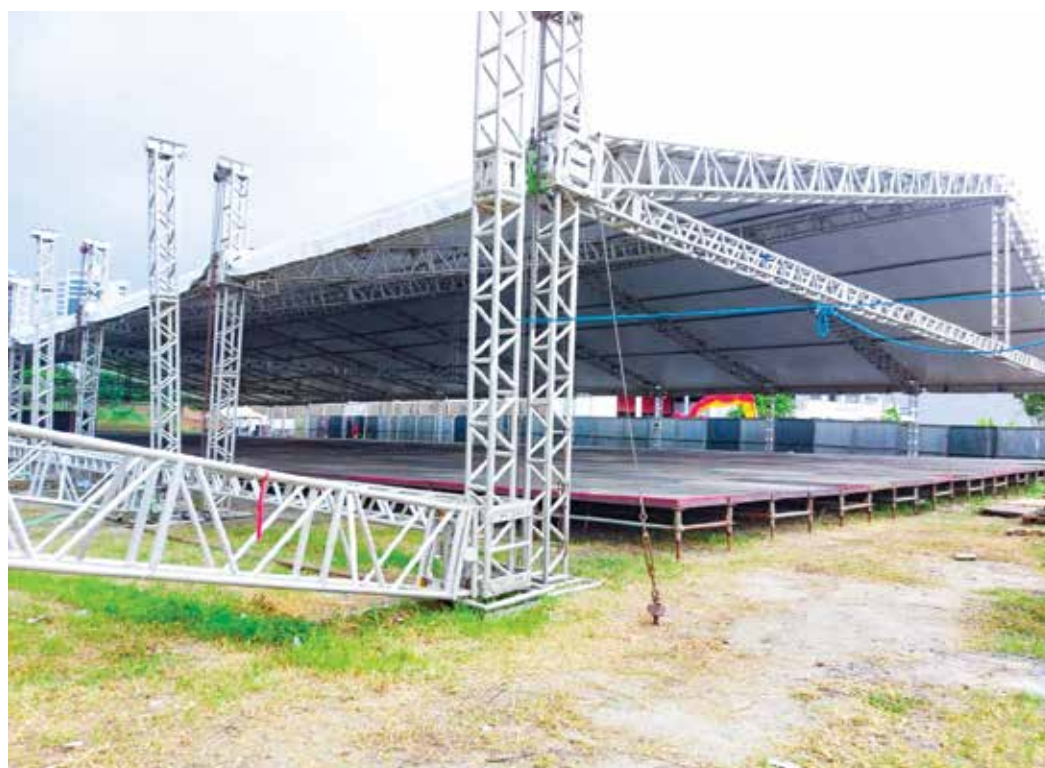
Estrutura em fase final de montagem vai abrigar mais de 500 artesãos, além de atrações musicais

ticipando da Feincartes, uma feira internacional de artesanato e decoração lá em Santa Catarina - essa exposição no Sul do país é inédita para os nossos artesãos. Por isso, não tenho dúvidas de que o Salão de Campina Grande será um grande sucesso”, acrescentou.