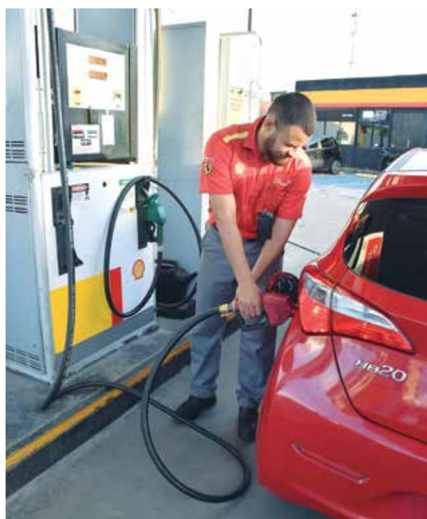
Gasolina apresenta variação de preço de 5,3% na capital

Com relação ao óleo diesel S10, houve recuo de preços em 83 postos, manutenção em 22 e elevação em um. O menor valor caiu de R$ 4,960 para R$ 4,880 (praticado em cinco postos) e o maior, de R$ 5,790 para R$ 5,590 (São José, em Cruz das Armas). A estimativa da Petrobras era de que o com-