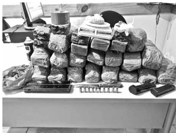
Os 20 quilos da droga foram apreendidos em Alhandra

O material foi abandonado por um grupo criminoso, assim que percebeu a entrada da PM na localidade. Os integrantes já foram identificados e seguem sendo procurados. A ação da Polícia Militar frustrou o plano dos criminosos que, conforme denúncias, planejavam distribuir as drogas para outros pontos do município. O caso foi levado para a delegacia de Alhandra.