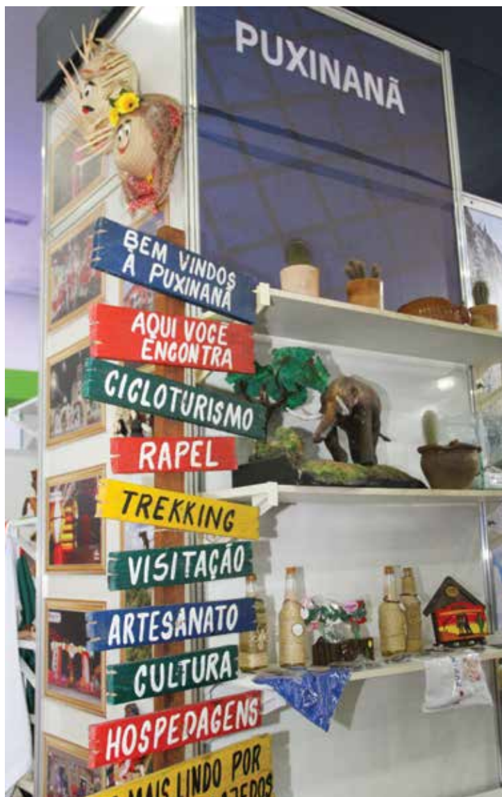
Município de Puxinanã apresentou a força do turismo de aventura