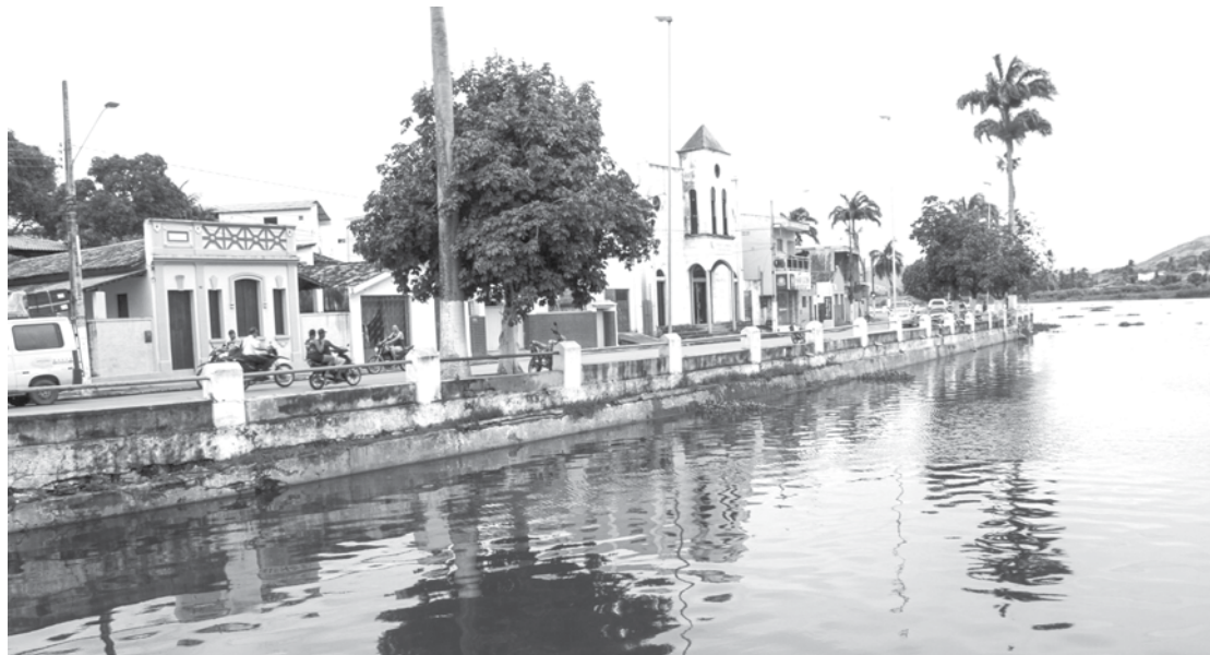
O rio testemunha a cidade